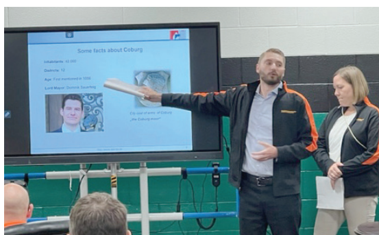
Präsentation über Coburg vor dem Lehrerkollegium von TTA