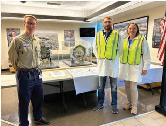
Besuch bei General Motors