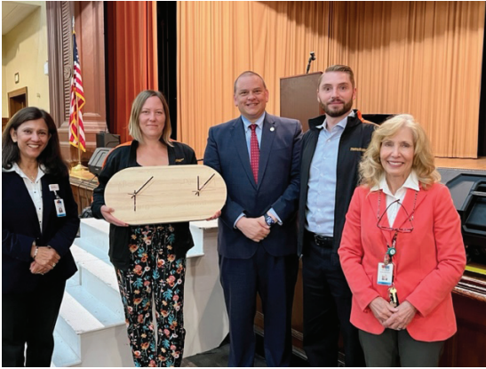
Geschenkübergabe in der Aula von TTA