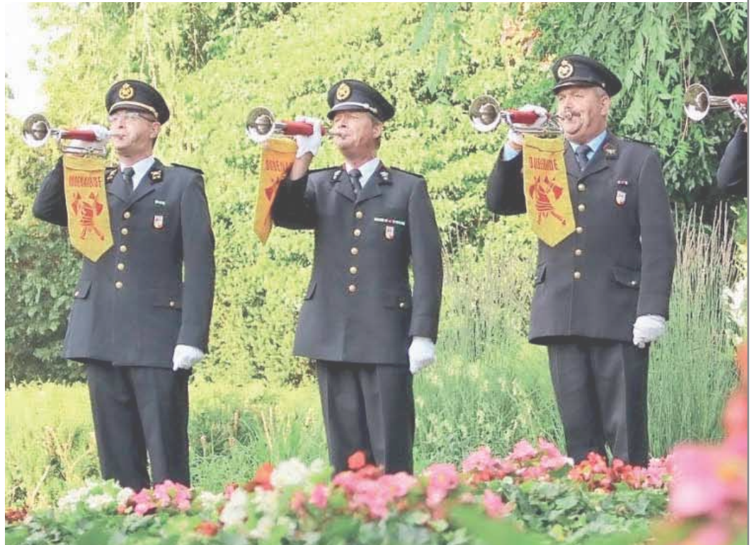
Vier Mitglieder der Oudenaarder Feuerwehr bliesen das Fanfarensignal „The Last Post“ auf dem Coburger Soldatenfriedhof in Oudenaarde.