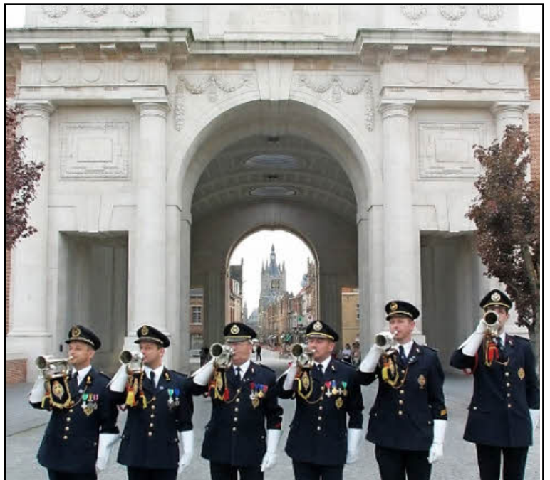
Jeden Abend um 20 Uhr erklingt am Menentor in der belgischen Stadt Ypern „The last Post“ zum Gedenken.