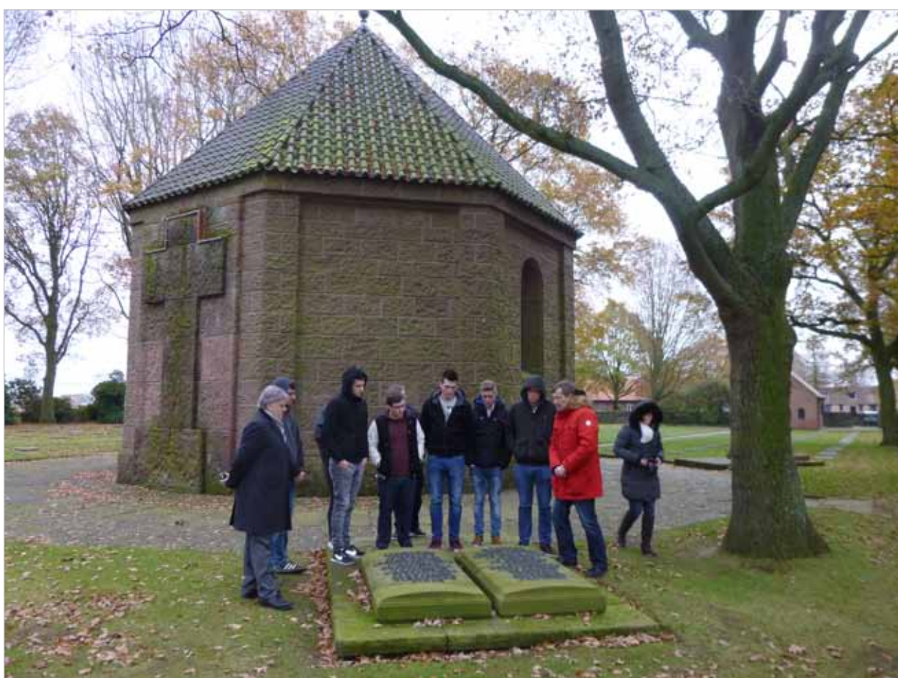
Bloemen ter nagedachtenis en als herinnering in verschillende landen, ontworpen door studenten van het VTI Waregem:

Na de indrukwekkende foto's van het land art project, stond een bezoek aan de Duitse militaire begraafplaats in Menen op de agenda. Ongeveer 48.000 Duitse soldaten die in de Eerste Wereldoorlog zijn gesneuveld, liggen begraven op de militaire begraafplaats van de stad, direct aan de Franse grens. Voor de leerlingen was het hun eerste bezoek aan een militaire begraafplaats. Zij waren dan ook onder de indruk en ontroerd door de inrichting van de begraafplaats. In de kapel in het midden van het kerkhof legden de leerlingen een gedenkplaat neer samen met een beeldhouwwerk van het kunstproject. Naast de klapproos als gedenkteken voor de Engelse en Belgische soldaten, stond op dit affiche ook het „vergeet-me-nietje“ als herdenkingsbloem van de Duitse Oorlogsgravencommissie. De districtsvereniging van Opper-Franken had ons op korte termijn een aantal corsagebloemen ter beschikking gesteld, die gedurende het hele verblijf door leerlingen en leraren werden gedragen.